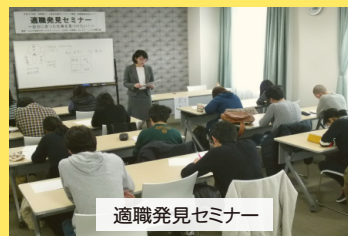
適職発見セミナー