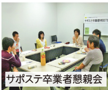
サポステ卒業生懇親会

進路が決定した後も職場定着や キャリアアップに向けて継続的に フォローアップします。