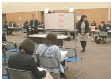
受付票を記入し、受付へ 希望の事業所も伝えます