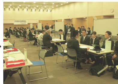
順番が来るのを待って 企業のブースへ！