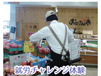
就労チャレンジ体験