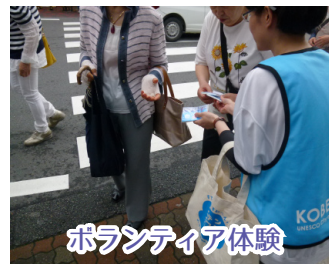
ボランティア体験