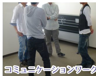
コミュニケーションワーク