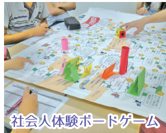
社会人体験ボードゲーム