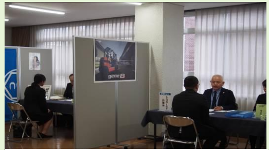
11/24(木) 西宮新卒者企業就職面接会の様子

企業が一つの会場に集まり、面接を行うイベントです。 ハローワーク・地方自治体・経済団体等が主催し、それぞれの面接会によって「新卒者向け（既卒3年以内も含む）」や「若年者向け」等々、 対象者や年齢が決められている場合がほとんど。 1つの面接会で 複数企業に応募でき、書類選考ナシで直接面接の機会を得ることができるのが最大のメリットです！