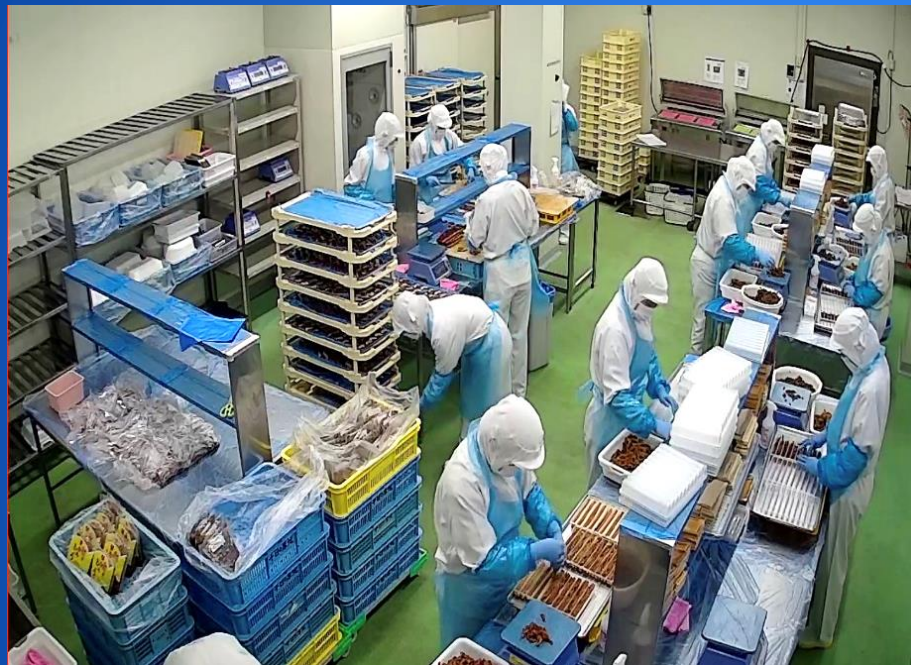
▲ 製造加工現場の様子