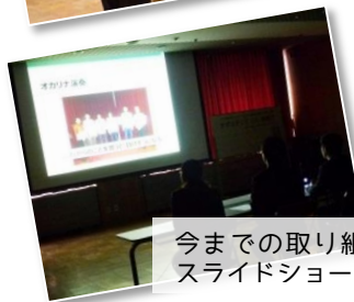
今までの取り組みをスライドショーで

参加者のうち、 2名は就職、1名は進学が決定 し、あとの3名も就職を目指してそれぞれ奮闘中です。新たな一歩を踏み出した6人を、こうべサポステはこれからも応援していきます！