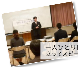
一人ひとり前に立ってスピーチ