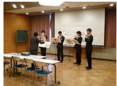
ずっと練習していたオカリナ。息の合った演奏にみんなうっとり。