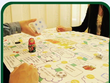
社会人体験 ボードゲーム