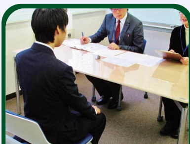
模擬面接練習 課題に合わせた面接練習をします。