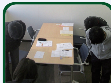
基本のマナー講座 社会人として必要なマナーを学びます