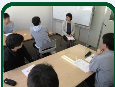
コミュニケーションセミナー (話す編・聞く編・職場編)