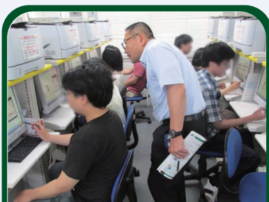
ハローワーク活用講座 効果的な活用方法を学びます。