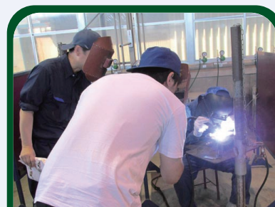
ポリテク加古川 見学ツアー